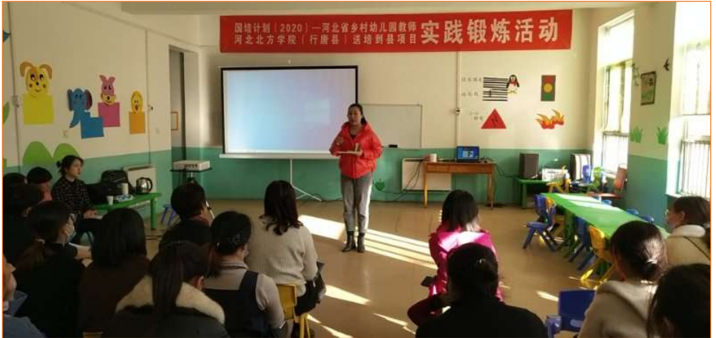
参训老师们认真学习与专家和做课老师深入探讨，在实践中提升自己。